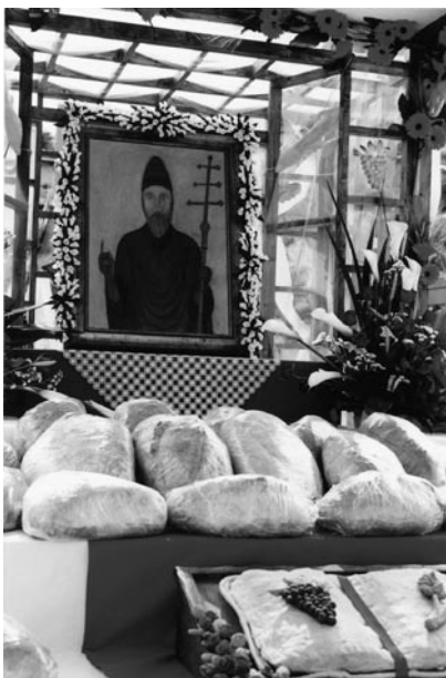
Sul carro del Pane si pone l’altarin con l’icona di S. Urbano e il Pane Benedetto.

Un popolo bracciantile indebolito comunque significava per le classi