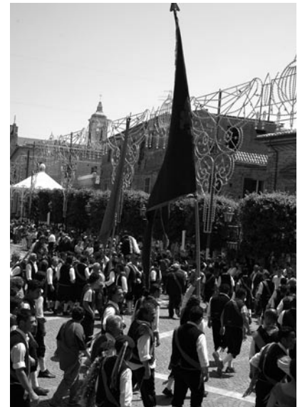
I banderesi ballano con le bandiere in piazza.

Come diremo in seguito è evidente che la complessità della festa nasconde un'altra origine ben più antica che afferisce al novero dei culti propiziatori agrari dei popoli italici sopravvissuti in epoca romana che si celebravano allo schiudersi della primavera quando le ansie per il futuro raccolto spingeva la popolazione rurale ad ingraziarsi le varie divinità agresti ed in modo particolare la dea Cerere. Come gli scavi archeologici documentano, il territorio bucclaneo, vicino a Teate, fu da sempre interessato dall'agricoltura per esservi alcuni "fundi" nei quali la coltivazione dei cereali e dell'olivo fu praticata per secoli. Una statuette votiva rappresentante un donna che tiene in mano una "focaccia" nell'atto di offrirla rinvenuta a Bucchianico è l'eloquente testimonianza di un culto dedicato a Cerere, protettrice delle messi. Come è noto agli antropologi le feste di maggio erano un'apoteosi di riti che celebravano la fertilità della natura, delle messi e della donna: così come si auspicava la rigenerazione della natura così si pregava per la fertilità della donna e una prole sana e numerosa. Una serie di feste di maggio, in continuazione delle usanze pasquali, racchiudeva antichi riti sulla fertilità raccolti per sincretismo nella tradizione devozionale e cultuale cristiana. Il mese di maggio nonostante la vigoria della natura lo renda il più bello dell'anno, per il contadino, coincideva con il periodo più difficile da superare