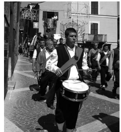
Il tamburino accompagna i banderesi in ogni rito.