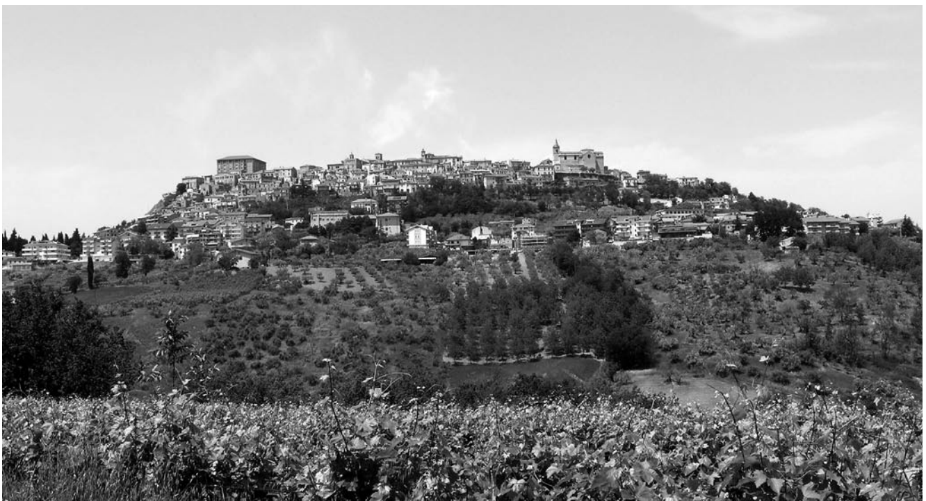
Veduta di Bucchianico da c.da Publiconi.