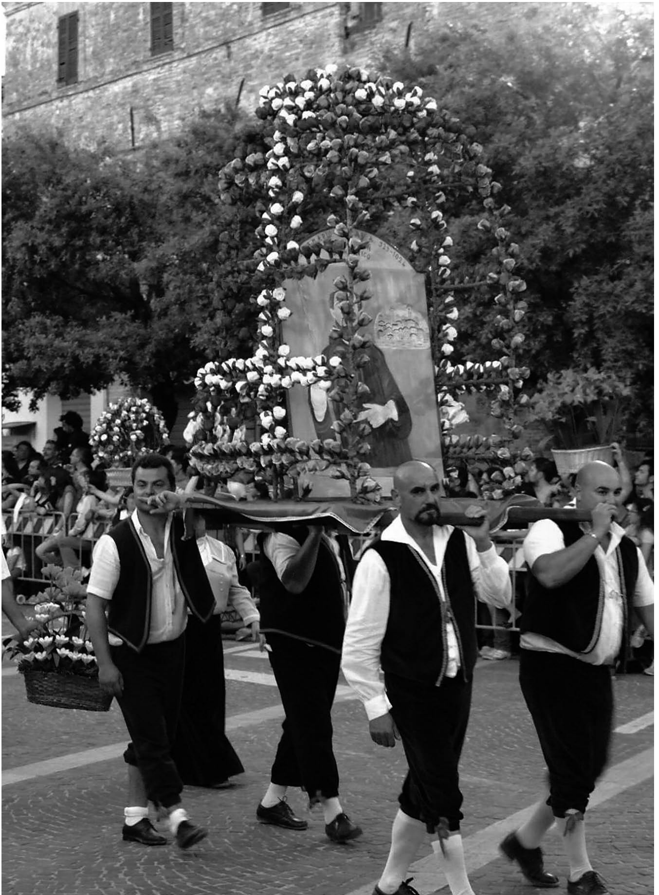
Icona di S. Aldemario, fondatore del monastero di S. Maria Maggiore e S. Urbano.