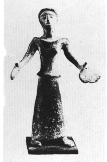
Donna che offre una focaccia. Statuetta votiva del III a.C. rinvenuta a Bucchianico. In AA.VV., La Provincia di Chieti, Chieti, 1990.

La leggenda mette in risalto l’intervento prodigioso del Santo patrono, la storica figura del Sergentiere e gli uomini di Bucchianico a rimarcare