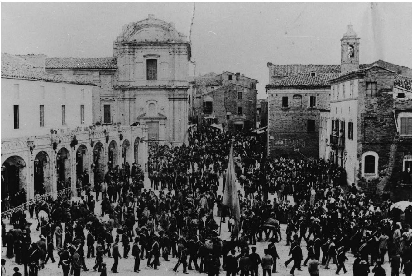
La Ciammaichella in piazza S. Angelo agli inizi del '900.