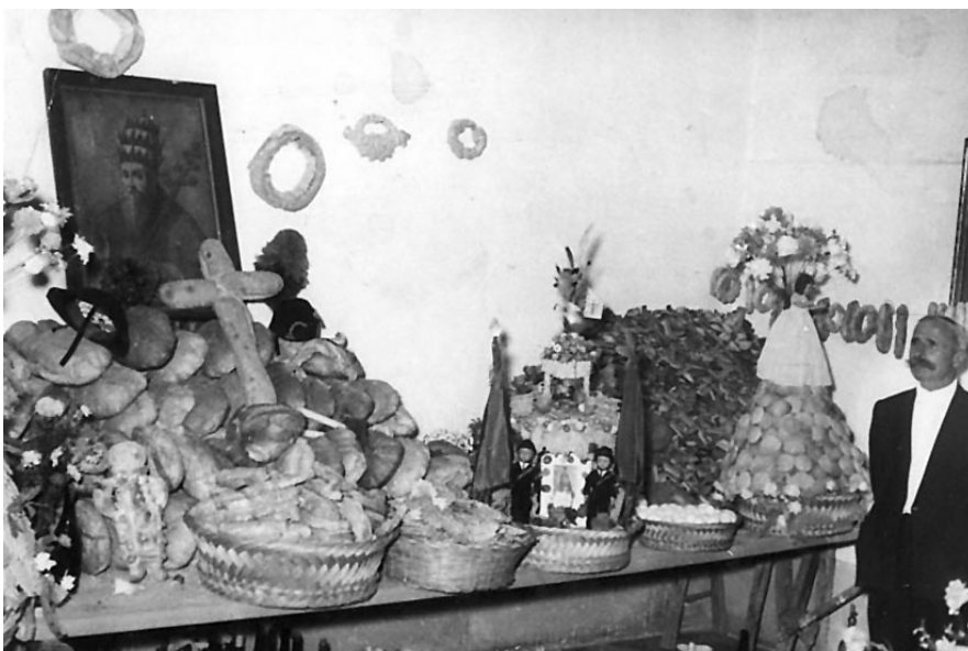
Da sempre il Pane Benedetto è simbolo di abbondanza (foto degli anni '50).